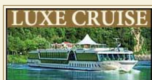
MS Amadeus Classic

De receptie en roomservice staan steeds klaar om u van dienst te zijn. Bij de excursies krijgt u een hoofdsetje mee zodat u draadloos de uitleg van de begeleiding kunt volgen, ook al staat u achteraan of juist even naar de details van een bezienswaardigheid te kijken.